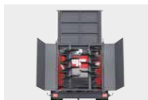
Гидравлически поднимаемая задняя стенка, уплотненная в нижней части резиновой лентой