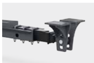
Дышло, амортизированное продольной рессорой