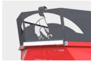
Индикатор положения задвижки