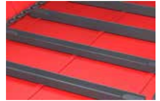
Пол с гидравлическим приводом и с возможностью регулирования скорости