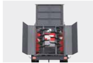
Гидравлически поднимаемая задняя стенка, уплотненная в нижней части резиновой лентой