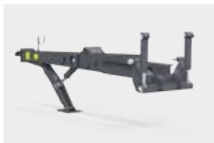
Сцепка с гидравлической амортизацией