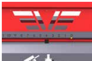
Индикатор подъема задвижки