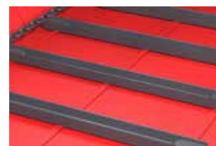
Пол с гидравлическим приводом и с возможностью регулирования скорости