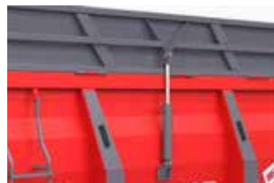
Возможность опускания и подъема гидравлического надставного борта. Управление осуществляется из кабины трактора