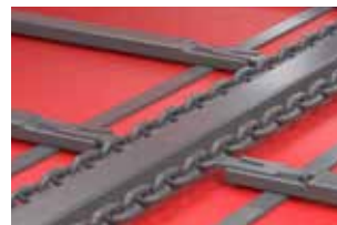
Гидравлический привод напольного конвейера с возможностью регулировки скорости