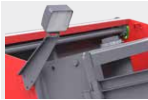
Рабочее освещение для работы после наступления темноты - прожекторы